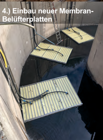
4.) Einbau neuer Membran-Belüfterplatten