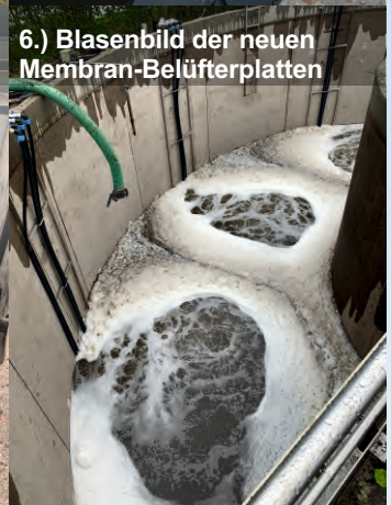
6.) Blasenbild der neuen Membran-Belüfterplatten