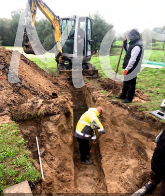
1.) Umschluss und Umleitung des Abwasserstroms