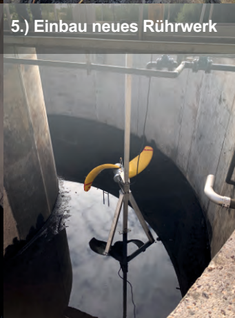
5.) Einbau neues Rührwerk