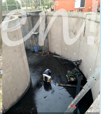
3.) Leerung und Reinigung des Belebungsbeckens