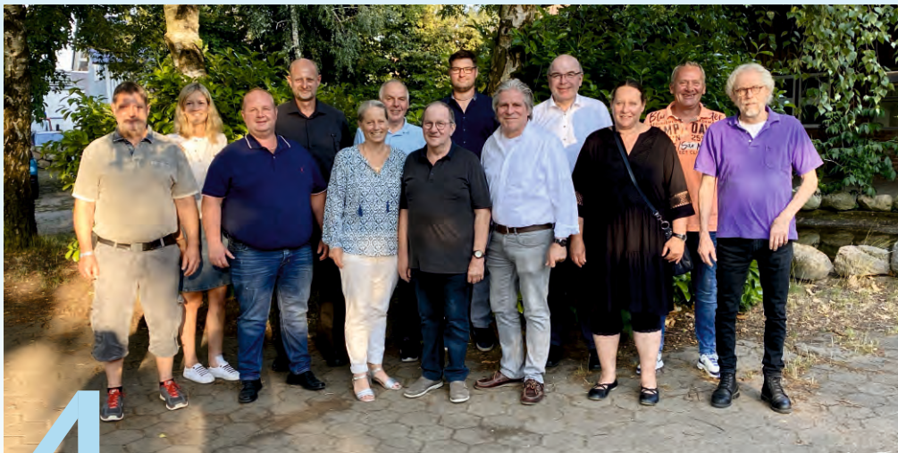
Die neue Gemeindevertretung der Wahlzeit 2023 - 2028

Für seinen / ihren Einsatz zum Wohle der Allgemeinheit spreche ich im Namen der Gemeinde herzlichen Dank und Anerkennung aus.“